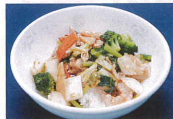
中華丼 写真はイメージです