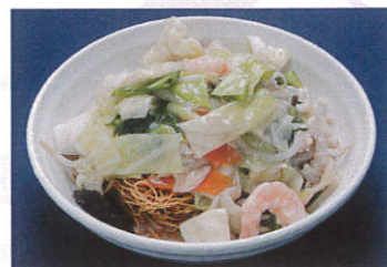
長崎皿うどん 写真はイメージです