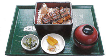
うな重 (小鉢・味噌汁・香の物付) 写真はイメージです