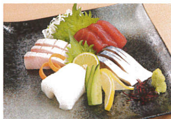
お造り盛り合わせ 写真はイメージです