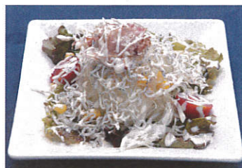
オニオンスライスサラダ(じゃこ入り) 写真はイメージです

* お造り盛り合わせ 1,200円 (4種盛) (仕入状況により内容が変わる場合がございます)