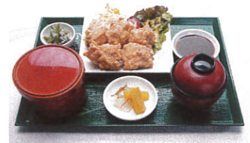
唐揚げ定食 写真はイメージです