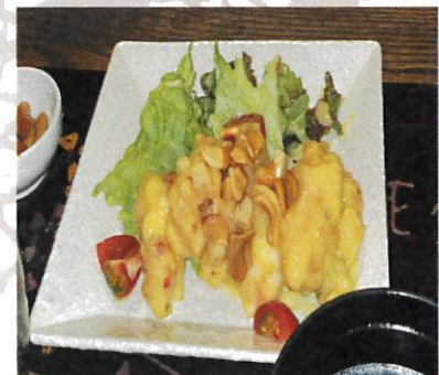
海老マヨネーズソース