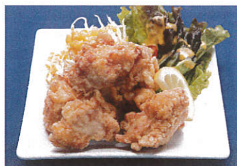
鶏の唐揚げ 写真はイメージです