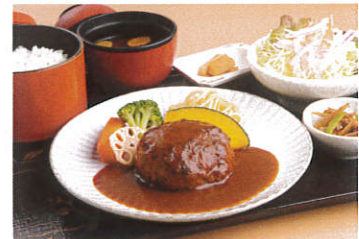
ハンバーグ定食 (デミグラスソース添え) 写真はイメージです