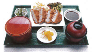
豚ヒレカツ定食 (小鉢・味噌汁・香の物・御飯) 写真はイメージです