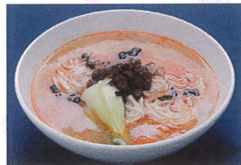
坦々麺 写真はイメージです