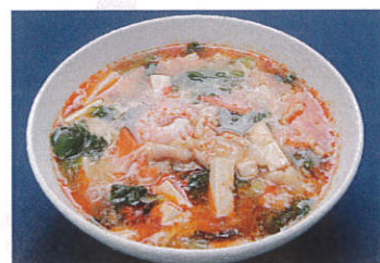
酸辛湯麺 写真はイメージです