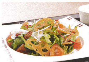
和風サラダ 写真はイメージです